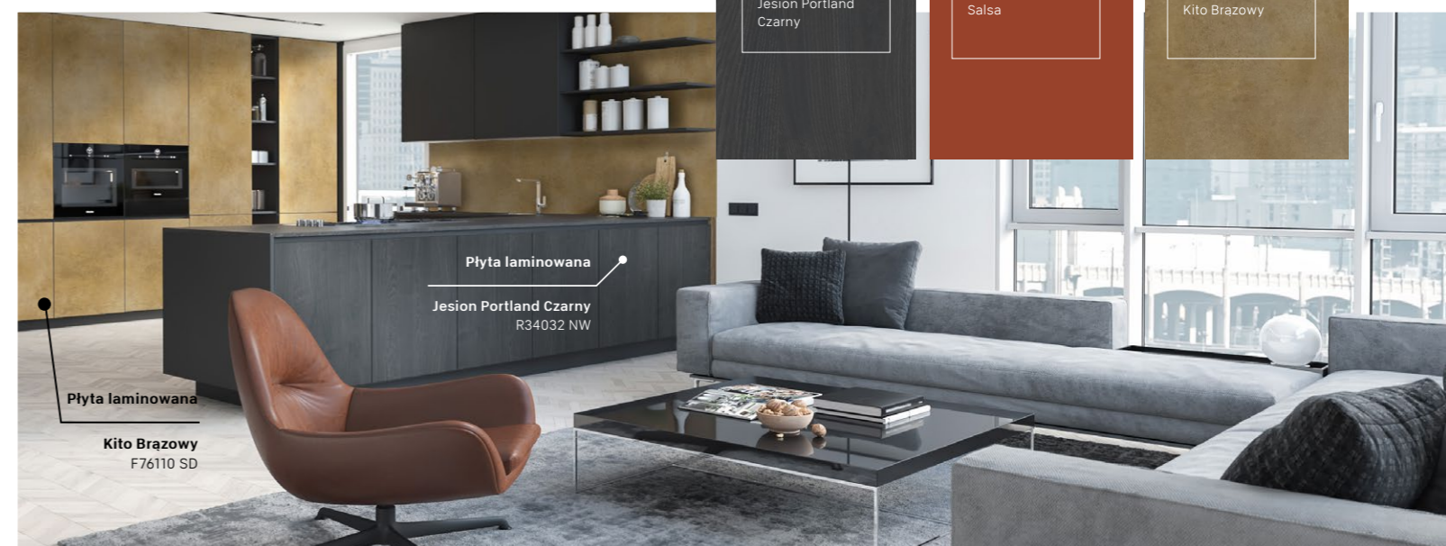
Rekomendacje produktowe Pfleiderer dla stylu art deco.

W najnowszym TrendBooku firmy Pfleiderer znajdziecie nie tylko najbardziej aktualne propozycje wzornicze, ale także liczne inspiracje do aranżacji niepowtarzalnych wnętrz w najmodniejszych stylach, wskazówki, jak dobrać kolory i struktury materiałów. Paleta rozwiązań jest bardzo szeroka – od jasnych, ciepłych dekorów odwzorowujących rodzime gatunki drewna, poprzez wyraziste struktury betonu, stali, aż po ponadczasowe drewna egzotyczne. Więcej inspiracji na www.trendbookpfleiderer.com