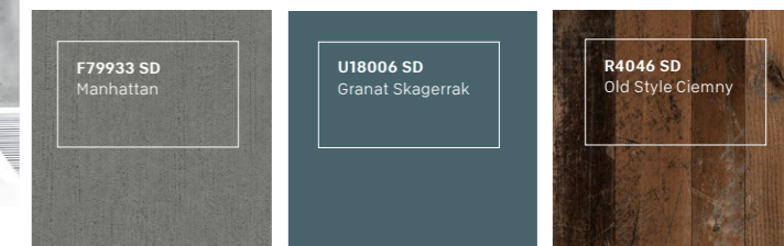
Rekomendacje produktowe Pfleiderer dla stylu industrialnego.

Męczą cię nadmiar przedmiotów, kolorów i detali? Lubisz szarości, metal, beton i chłodne w wyrazie wnętrza? Styl industrialny jest właśnie dla Ciebie. Najważniejsza jest w nim przestrzeń, brak podziałów, jak najmniej ścian i elementów zakłócających poczucie wolności. Odpowiednie oświetlenie podkreśli wrażenie lekkiego chłodu i neutralności a powierzchnie w odcieniach szarości, antracytu, bieli i czerni sprawiają, że wnętrze wydaje się bardziej przestronne. Cegła, beton, stal, szkło i naturalne drewno – to materiały i powierzchnie, które współtworzą styl industrialny. Idealnie harmonizuje z nimi struktura powierzchni Sandpearl (SD).